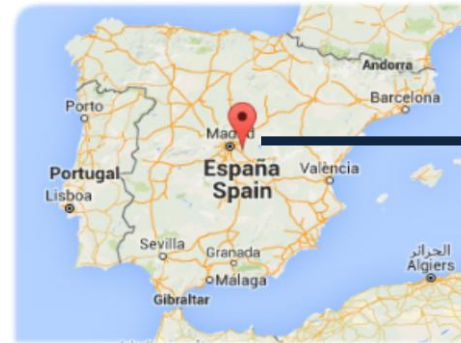
LOCALIZACIÓN / POSITION