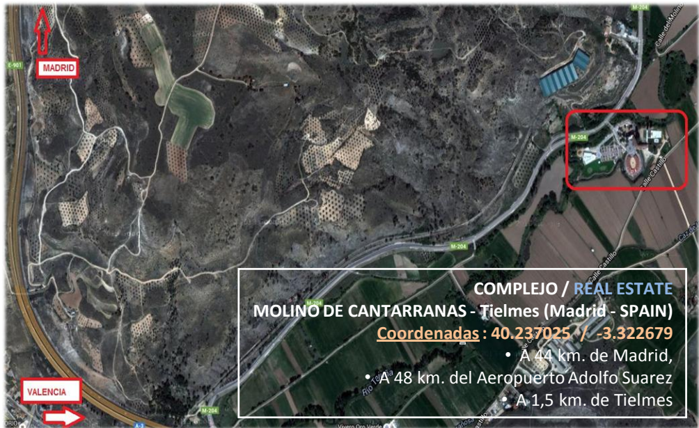
MAPA DE UBICACIÓN / MAP